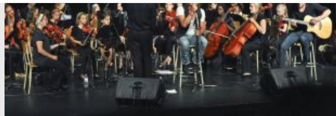
Aquaplane en compagnie de l'Orchestre symphonique des jeunes de Rosemère.

Sujets : école Horizon Jeunesse de Laval , Pirate des Caraïbes , Région de Rosemère , Complexe de Vivaldi