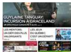
NORD INFO mars 2, 2019