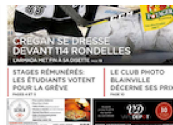
LA VOIX DES MILLE-ÎLES février 27, 2019