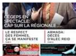
LA VOIX DES MILLE-ÎLES mars 6, 2019