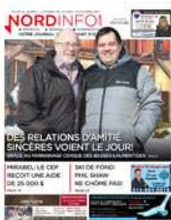
NORD INFO février 23, 2019