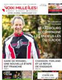
Voix des Mille-Îles février 20, 2019