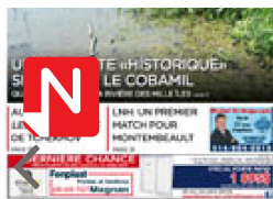
NORD INFO mars 9, 2019